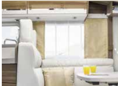
Pisa / Rana