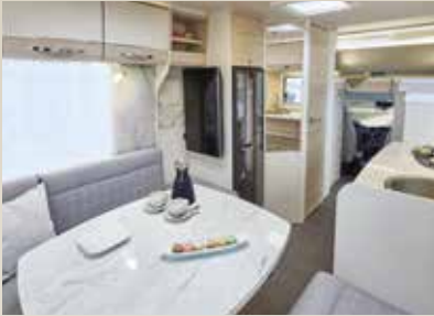
Milano / Lasca