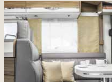
Leder grau / leather grey / cuir gris / Rana