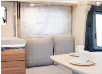
Milano / Lasca