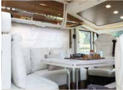
Leder beige/leather beige/ cuir beige / Maka