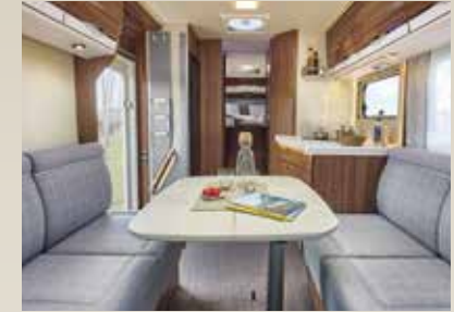
Milano / Lasca (Navarra)