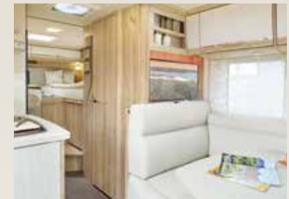
Leder beige/leather beige/ cuir beige / Maka