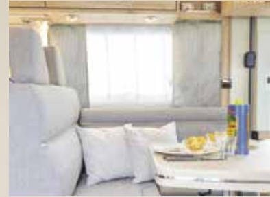
Milano / Lasca (Chalet)