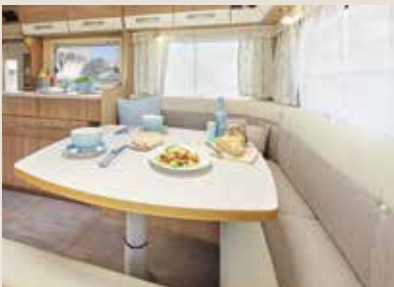
Dara / Maka