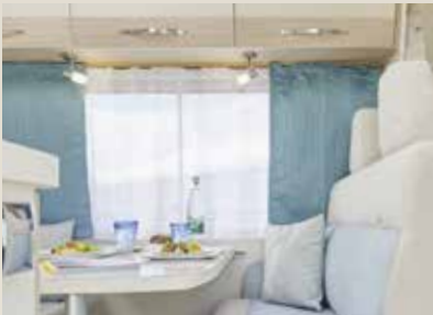
Livorno / Mara