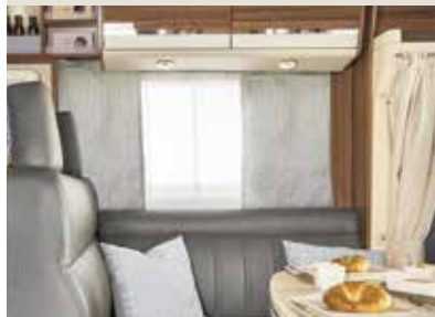
Leder grau / leather grey / cuir gris / Lasca