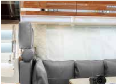
Leder grau / leather grey / cuir gris / Maka