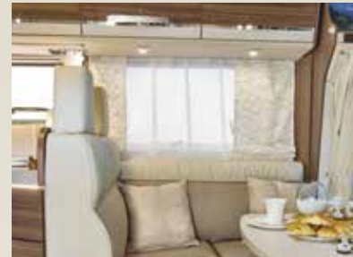
Dara / Maka