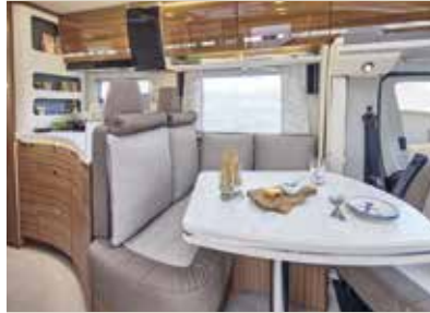
Como / Maka